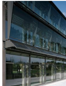
Thema 16: Gebäudehülle