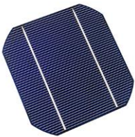
Thema 9: Solarzelle