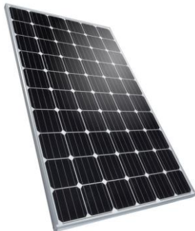
Thema 10: PV-Module