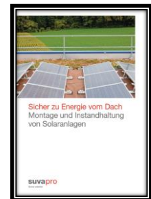
Thema 28: Sicherheit, Arbeitsschutz, Gesundheitsschutz