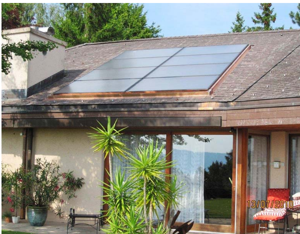
Abb. 1: Einfamilienhaus in Zumikon (Beispiel 1) mit Erdwärmesonden-WP kombiniert mit 17 m 2 Kollektorfläche für Wassererwärmung, Heizungsunterstützung und Schwimmbadwassererwärmung.

Sonnenkollektoren eignen sich besonders gut als Ergänzung von Wärmepumpen – zum Vorteil von Bauherrschaften und Planern. Anmerkungen zur intelligenten Kombination dieser umweltfreundlichen Wärmeerzeuger.