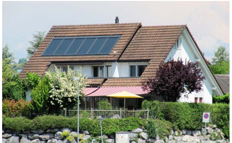
Abb. 2: Einfamilienhaus in Jona-Rapperswil (Beispiel 2) mit Luft-Wasser-WP kombiniert mit 17 m 2 Kollektorfläche für Wassererwärmung und Heizungsunterstützung.

Fazit: Ein Wärmespeicher muss eine Temperaturschichtung aufweisen. Im obersten Teil, im Bereich der WW-Nutzung, ist der Speicherinhalt immer 60 °C warm. Im mittleren Bereich mit Temperaturen von rund 40 °C sind die Stützen für den bedarfsgerechten Wärmeeintrag durch die WP installiert. Unten, auf der Höhe des Wärmetauschers des Solarkreislaufes, liegen die Temperaturen möglichst zwischen 10 °C und 40 °C – ausser die Sonne bringt so viel Wärme, dass der gesamte Speicher durchgeladen wird.