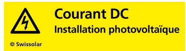
Illustration 6 : Autocollant d'avertissement pour les lignes DC, Swissolar