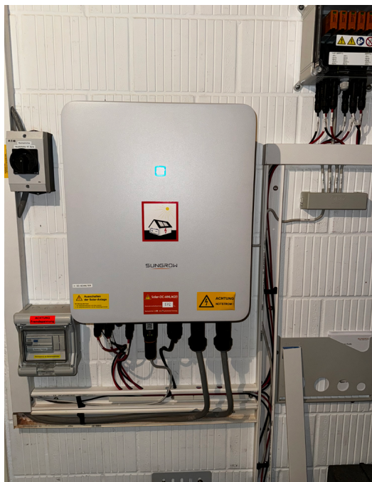
Figure 2 : Vue avec des canaux ouverts, ASCE