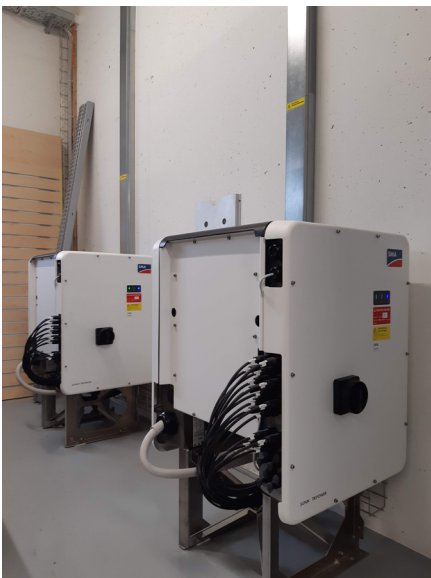
Figure 4 : Commerce et industrie, CKW

Dans les bâtiments commerciaux ou industriels, des tracés séparés sont généralement installés en raison du grand nombre de câbles de chaîne vers l'onduleur et de la séparation ordonnée des lignes AC et DC. Le couplage inductif dépend essentiellement de la distance entre les deux lignes et de la longueur du tracé parallèle des lignes. Des distances aussi grandes que possible sur le tracé des câbles ou l'utilisation de cloisons métalliques contribuent à maintenir le couplage à un faible niveau.