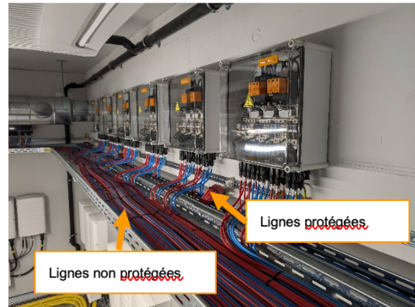
Figure 7 : Lignes protégées et non protégées, AESC

La zone de protection contre la foudre ZPF0 est la zone qui est menacée par le champ électromagnétique non amorti de la foudre. Les systèmes internes peuvent être exposés à la totalité ou à une partie du courant de foudre.