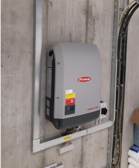
Figure 3 : Maison individuelle, CKW

Dans les bâtiments commerciaux ou industriels, des tracés séparés sont généralement installés en raison du grand nombre de câbles de chaîne vers l'onduleur et de la séparation ordonnée des lignes AC et DC. Le couplage inductif dépend essentiellement de la distance entre les deux lignes et de la longueur du tracé parallèle des lignes. Des distances aussi grandes que possible sur le tracé des câbles ou l'utilisation de cloisons métalliques contribuent à maintenir le couplage à un faible niveau.