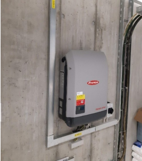
Abbildung 3: EFH, CKW

In Gewerbe- oder Industriebauten werden aufgrund der vielen Strangkabel zum Wechselrichter und der Ordnungstrennung von AC- und DC-Leitungen, meist getrennte Trassees installiert. Die induktive Kopplung hängt im Wesentlichen vom Abstand der beiden Leitungen und der Länge der Parallelführung der Leitungen ab. Möglichst grosse Distanzen auf dem Kabeltrasse oder die Verwendungen von metallischen Trennwänden helfen dabei, die Kopplung gering zu halten.