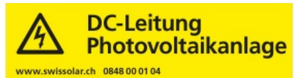
Abbildung 6: Warnkleber für DC-Leitungen, Swissolar