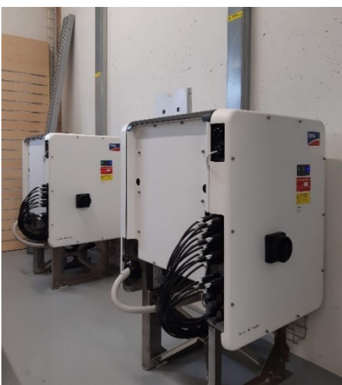
Abbildung 4: Gewerbe und Industrie, CKW

In Gewerbe- oder Industriebauten werden aufgrund der vielen Strangkabel zum Wechselrichter und der Ordnungstrennung von AC- und DC-Leitungen, meist getrennte Trassees installiert. Die induktive Kopplung hängt im Wesentlichen vom Abstand der beiden Leitungen und der Länge der Parallelführung der Leitungen ab. Möglichst grosse Distanzen auf dem Kabeltrasse oder die Verwendungen von metallischen Trennwänden helfen dabei, die Kopplung gering zu halten.