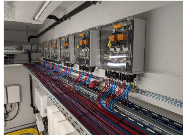
Abbildung 7: Geschützte und ungeschützte Leitungen, VSEK

Die Blitzschutzzone LPZ0 ist die Zone, die durch das ungedämpfte elektromagnetische Feld des Blitzes gefährdet ist. Die inneren Systeme können dem vollen oder einem anteiligen Blitzstrom ausgesetzt sein.