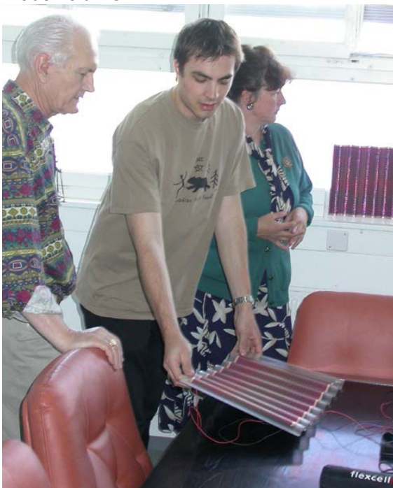
Entreprise Flexcell, Yverdon VD