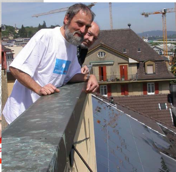
Institut de Microtechnique, Neuchâtel