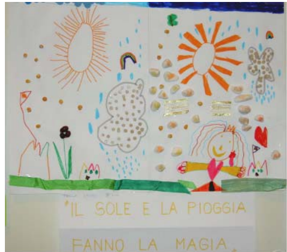
Concorso disegno 1° Premio bambini 3° livello: TECLA LALOLI , scuola dell'infanzia di GORDEVIO

file: Vincitori concorso disegno Avegno 20.05.05.doc 2 di 4