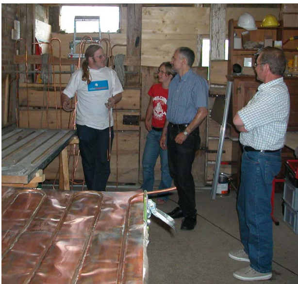
Niedermuhren FR, Solar Support