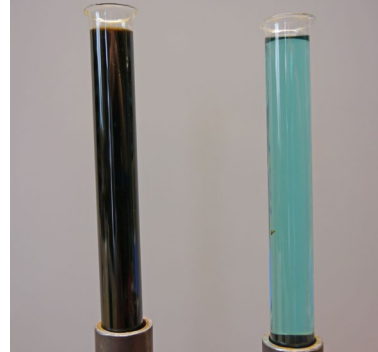
Abbildung 2: Wärmeträger im Neuzustand (rechts) und nach thermischer Überlastung (links)

Sowohl Propylen- wie auch Ethylenglykole sind nur bis rund 170 ° C temperaturbeständig. Über dieser Temperatur beginnt die thermische Zersetzung. Es entsteht eine organische Säure und der pH-Wert sinkt. Durch Additive kann das Absinken des pH-Wertes verzögert werden und die antikorrosiven Eigenschaften bleiben damit länger erhalten.